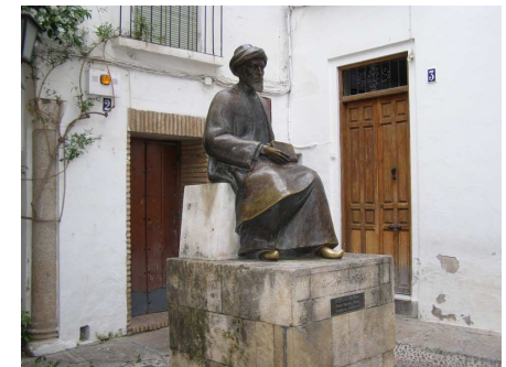
Moses Maimonides (1135-1204) Statue in Cordoba